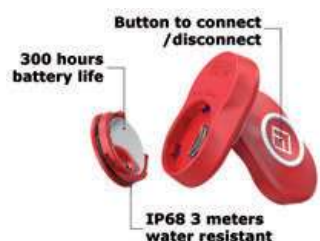
14.969.01 Trasmettitore sulla persona