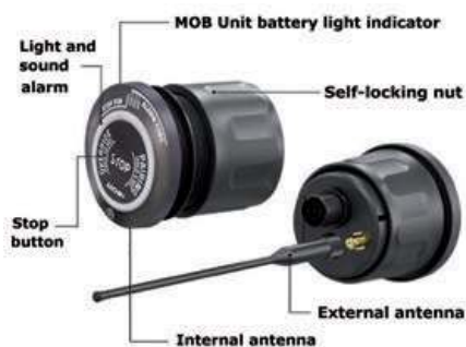
14.968.02 Ricevitore in barca