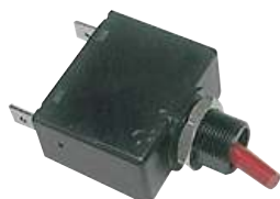
Polo singolo / Toggle & button